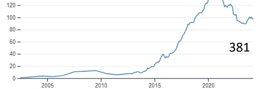
FSC certified area, ha